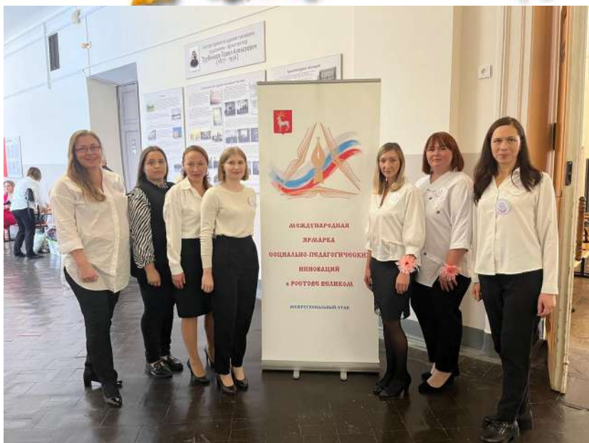
XV Ярмарка социально-педагогический инноваций, мастер класс «Эмоциональный интеллект – ключ к успеху». 15.12.2023г.