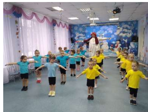
Педагогический субботник ГАУ ДПО «Институт развития образования»