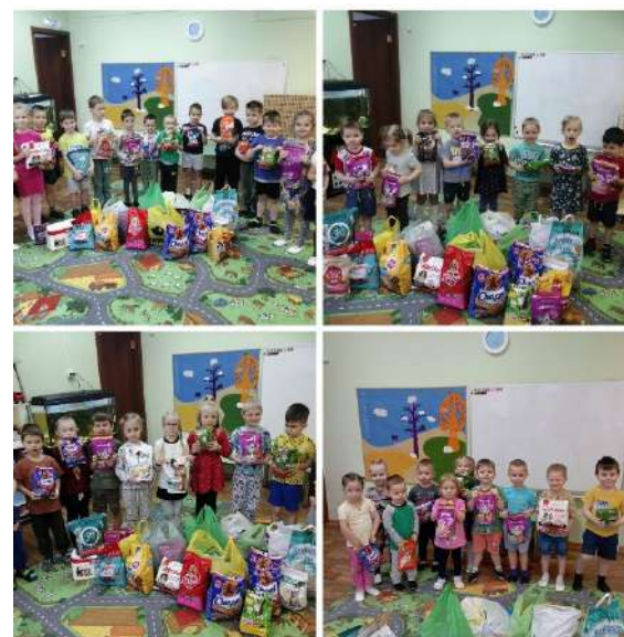
Благотворительная акция «Протяни руки к лапкам»