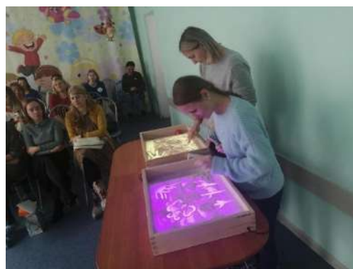
МИП «Педагог для всех», 23-24гг.