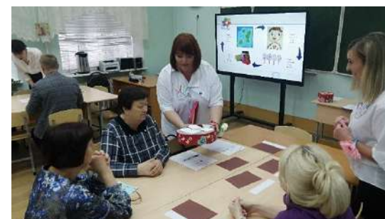
Городская презентационная площадка «Инновационное образовательное пространство МСО г. Ярославля» 3 ноября 2023г.