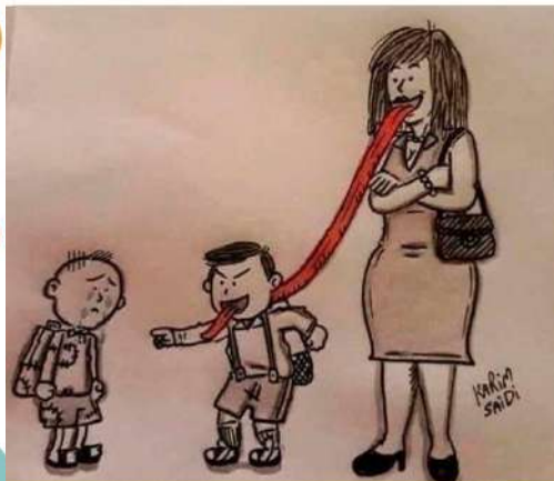
весёлый школьный учитель