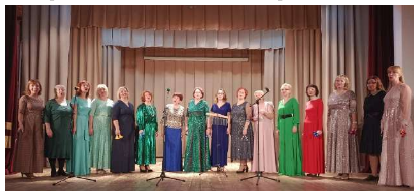
Конкурс творческого мастерства пед работников МСО г. Ярославля «Мастер асс», победитель.