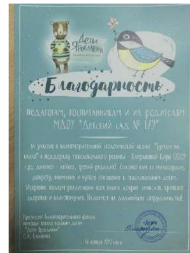
Экологическая акция по сбор макулатуры «Бумага на благо»