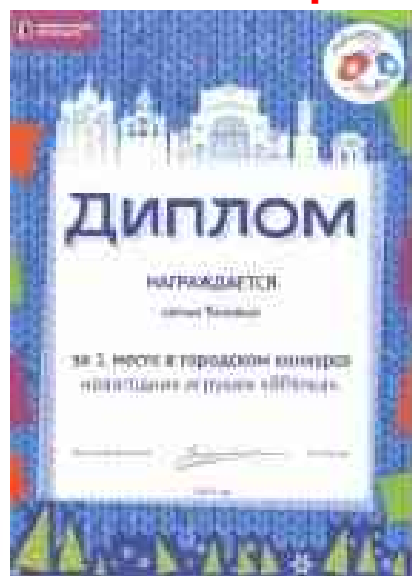
Городской конкурс «Яр Ёлка»