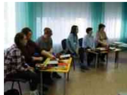
Мастер класс «Использование блоков Дьенеша в работе с детьми с ОВЗ»