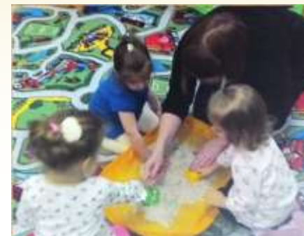
Группы раннего развития