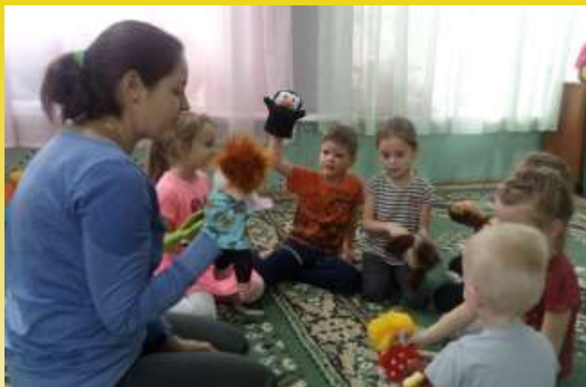
Группы компенсирующей направленности