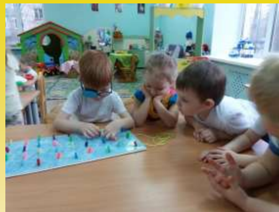
Группы комбинированной направленности