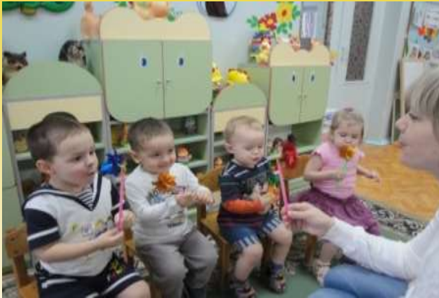
Артикуляционный и дыхательный тренинг