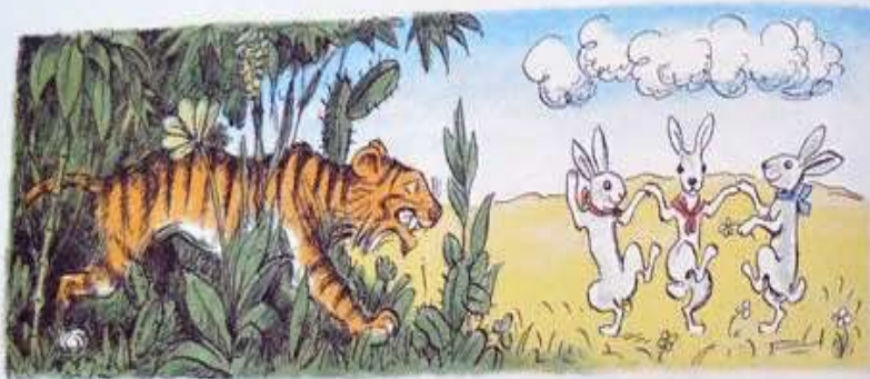
ТРИ ВЕСЕЛЫХ ЗАЙЧИКА