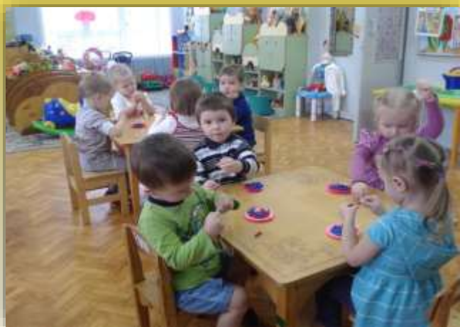
Бусы для мамы