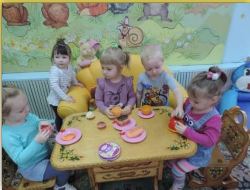
Подражательно – эмоциональная игра «В гостях у куклы»