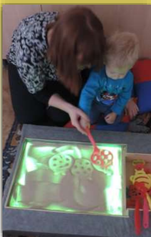
Световой стол для рисования песком