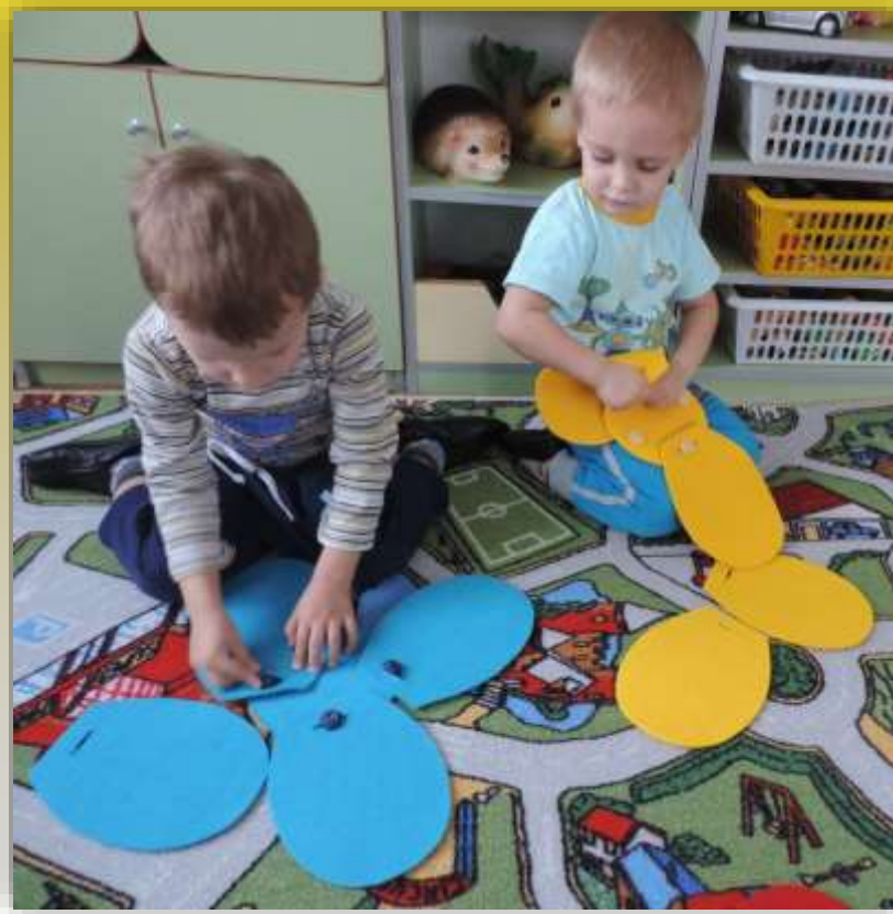
Игры с пуговицами «Цветочная поляна»