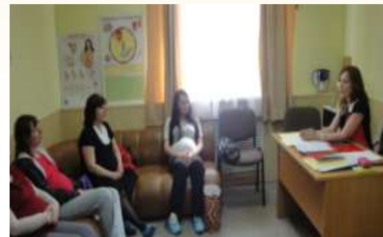
График работы: вторник 1 раз в квартал, с 13.00 до 15.00 часов.

Специалисты: учителя – логопеды и педагог – психолог.