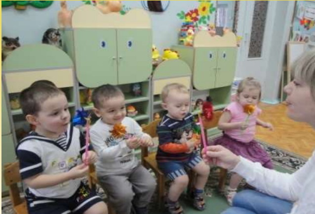
Артикуляционный и дыхательный тренинг