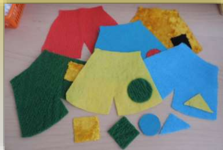
Игра «Коробка с тканями»