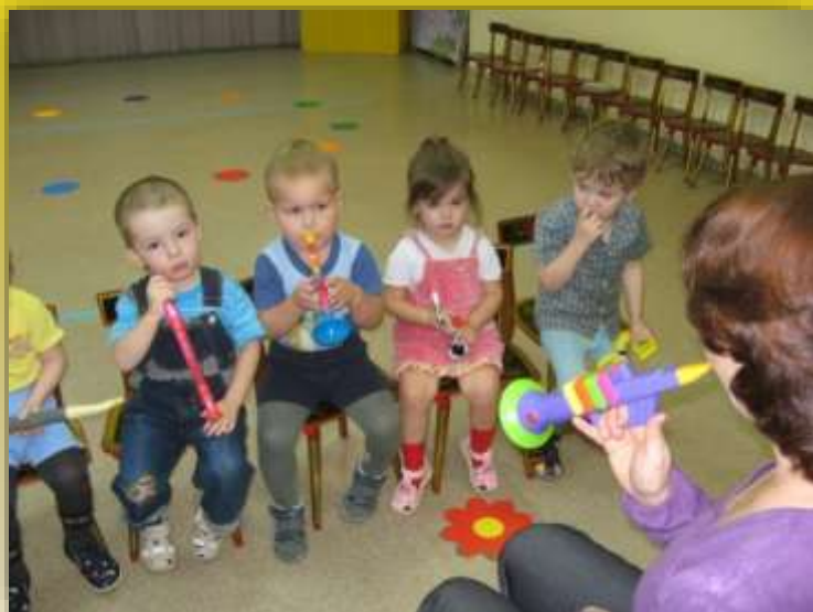
Мы на дудочках играем...