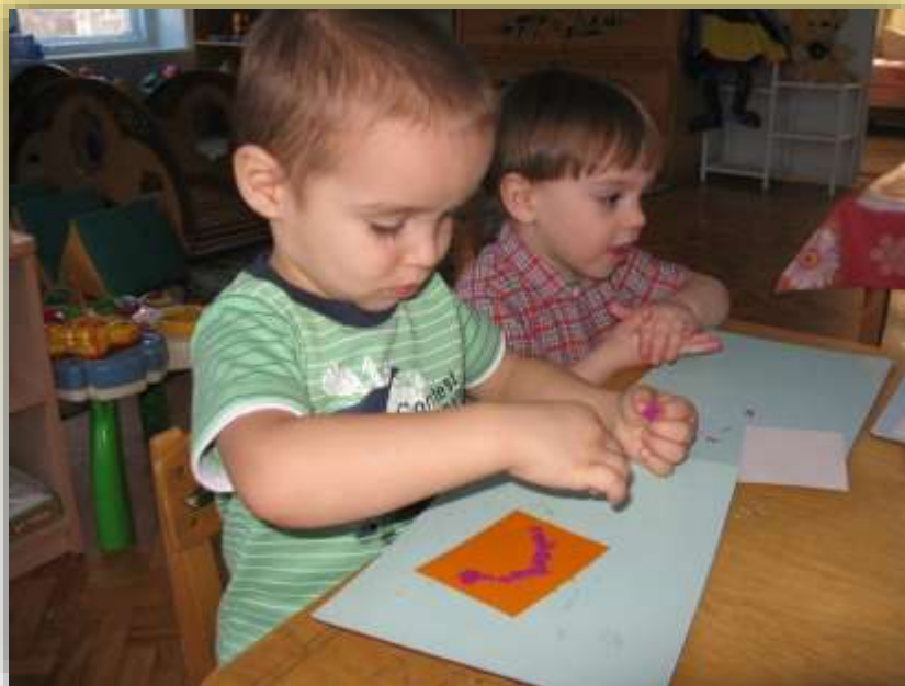
Работа с пластилином