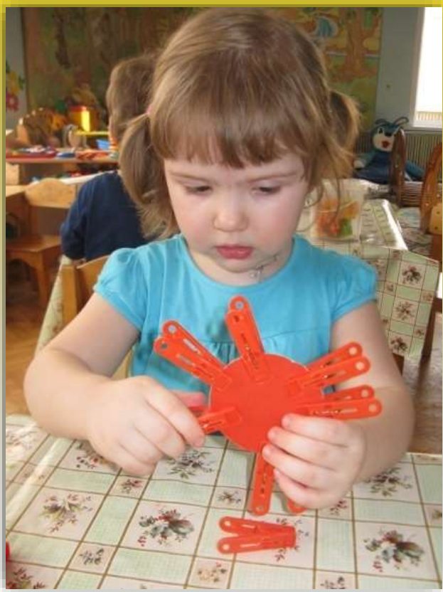
Игры с прищепками «Собери цветок»