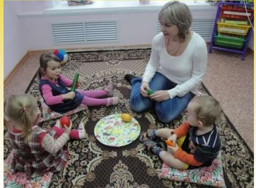
Подгрупповое логопедическое занятие «Полезные овощи»