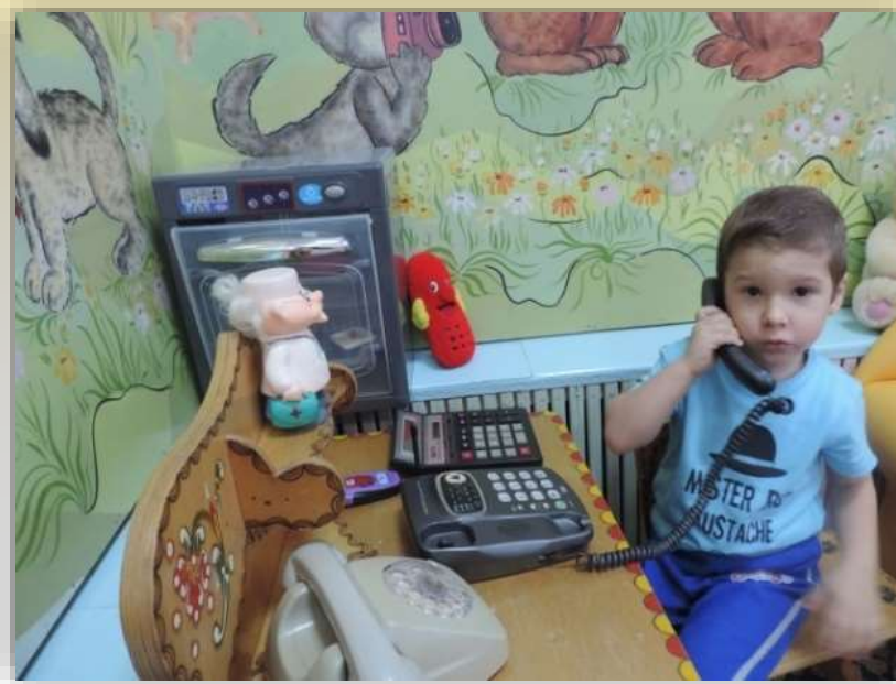
«Телефон» (Позвони другу)